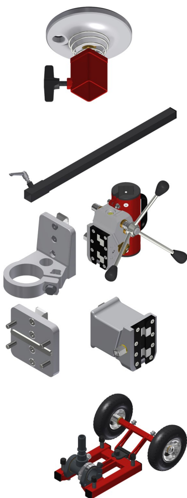
Golv- och väggborring med 40 + stämpstativ samt närbild av expanderfot och bultplatta.